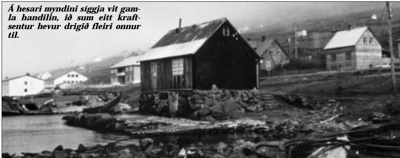
Á hesari myndini síggja vit gamla handilin, ið sum eitt kraftsentur hefur drigið fleiri onnur til.