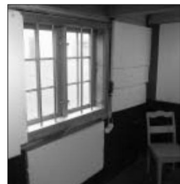
Omanfyri, síggja vit fremst gamla handilin, har alt byrjaði. Omanfyri sæst Heygahandilin. Aftanfyri gamla handilin hómast neystið, sum eisini er gjørt í stand. Eisini síggja vit gamla handilin innan.